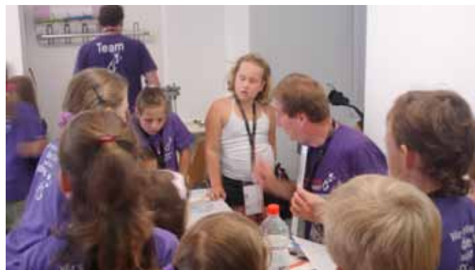
Universidad de los niños (Kinderuni), Viena 2009