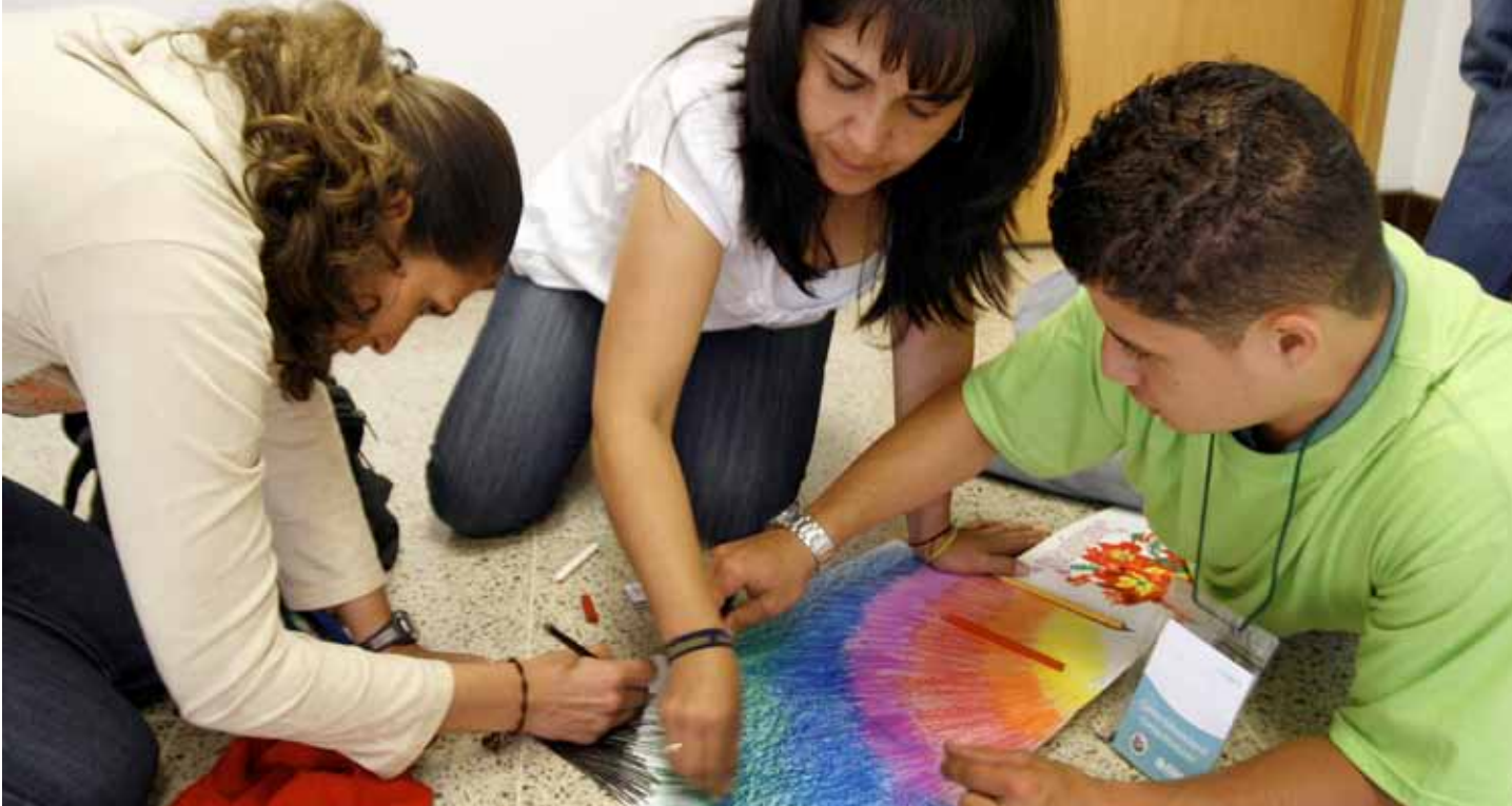
Grupo de profesores. Encuentro ¿Por qué existen los colores? 2009

La Universidad de los niños incide sobre, y de hecho transforma, tres cuestiones importantes en EAFIT: