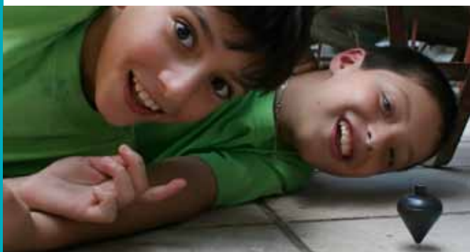
Aprender jugando. El arranque. Encuentro ¿Cómo funciona un carro? 2007