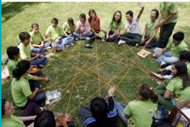
Círculo. Telar del guardián. 2008

En la Universidad de los niños EAFIT, el círculo , símbolo de unidad, es nuestra forma de organización preferida. Con esta manera de ubicarnos espacialmente se pretende crear una atmósfera donde los niños en permanente contacto visual -en un círculo todos ven a todos- se reconozcan a sí mismos y a los otros como sujetos legítimos. En el círculo concentramos nuestros intereses como grupo para conversar y reflexionar sobre las experiencias; en círculo planteamos hipótesis y enfrentamos nuestras ideas; en círculo aclaramos nuestras inquietudes y hacemos acuerdos. Al jugar, al conversar, no nos damos la espalda y somos iguales en nuestra intención y deseo de conocimiento, distintos desde la singularidad de cada uno.