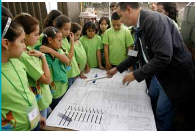
Encuentro ¿Cómo se construye un edificio? 2008

La misión de la Universidad de los niños EAFIT es propiciar una relación perdurable entre niños y jóvenes de diversos orígenes sociales y los saberes investigativos y científicos que se producen en la Universidad, mediante la realización de ciclos anuales en donde las preguntas, las vivencias y la conversación son la base para la construcción de nuevo conocimiento.