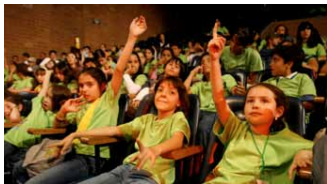
Conversaciones con el profesor. Encuentro ¿Cómo funciona la televisión? 2008

Las preguntas hacen que niños y jóvenes se abran ante el mundo. Por eso, queremos interesarlos en asuntos que quizás ya parezcan resueltos por otros